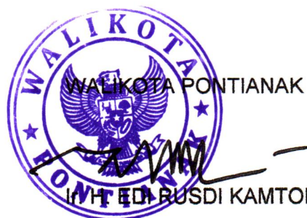
IHT EDI RUSDI KAMTONO, MM, MT